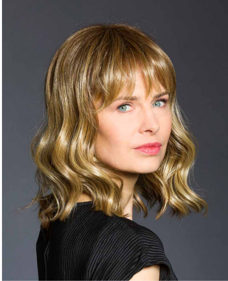
TABEA HI SF Chocolate/Cream-Balayage