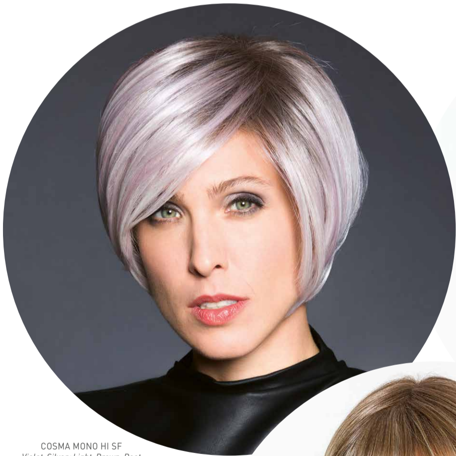
COSMA MONO HI SF Violet-Silver+Light-Brown-Root

VANILLA-LIGHT-BALAYAGE , die als Basis auf Vanilla-Light-Root zurückgreift sowie CHOCOLATE/CREAM-BALAYAGE , welches als moderne und zudem sehr natürliche Variante von Chocolate/Cream-Root zu interpretieren ist. ■