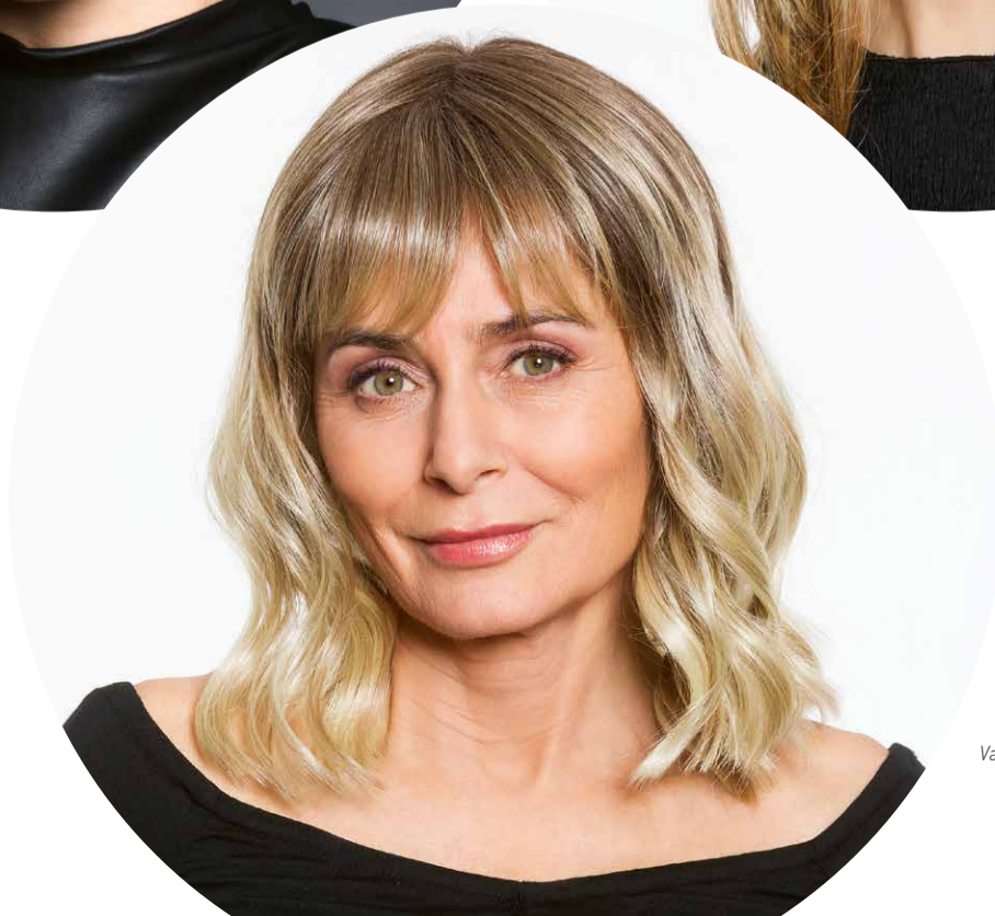
TABEA HI SF Vanilla-Light-Balayage