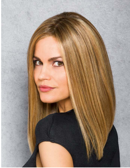
THE GRACE Caramel-Root