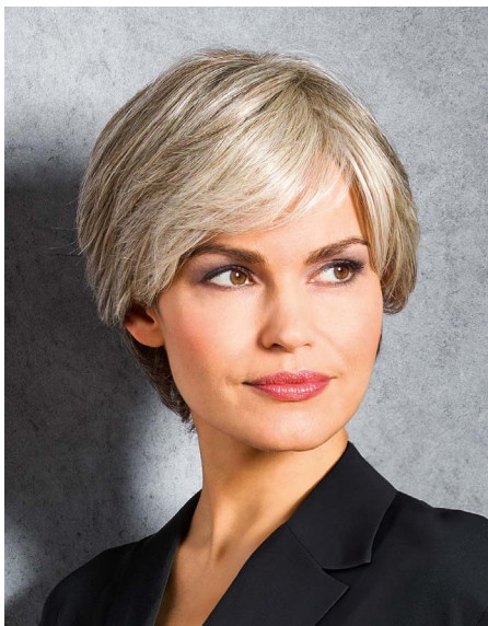
THE CLASSIC Smoke-Grey

THE SPLENDID überzeugt als Bob mit exaktem Vorschnitt und perfekt sitzender Nackenpartie. Ein Kurzhaarschnitt mit etwas Bewegung bietet THE SWIFT , deren Look durch unterschiedliches Styling des Ponys variiert werden kann. THE CLASSIC ist ebenfalls ein Kurzhaarschnitt, der mit seinem glatten Haar eine zeitlose Eleganz verkörpert. Auch für große Köpfe ist etwas dabei: Erweitert wurde die Platinum Hair Line durch die Modelle THE ELEGANT LARGE und THE STARLET LARGE, die es bisher nur als kleinere Varianten gab.