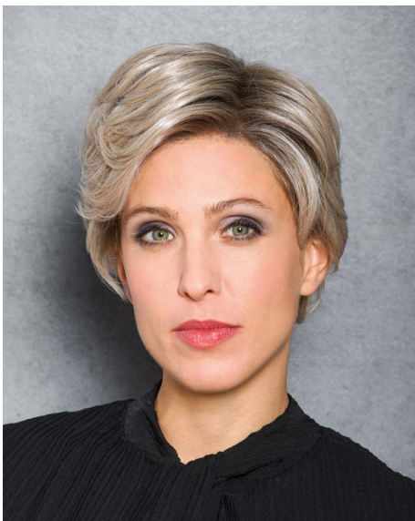
THE SWIFT Pearl-Blond-Root